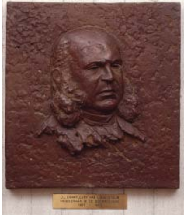
Figuur 3. Plaquette UvA.

Hij was een van de initiatiefnemers van het Nederlandsch Weekblad voor Geneeskundigen dat in 1851 werd opgericht uit