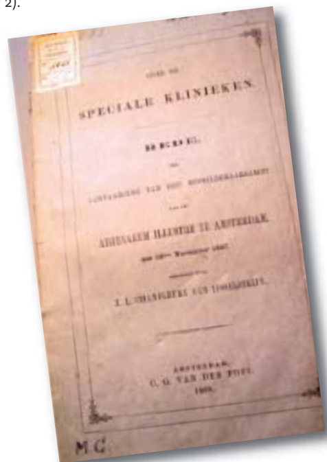
Figuur 2. Titelpagina rede 'Over de speciale klinieken'.

Dermatoloog, afdeling Dermatologie, AMC, Amsterdam